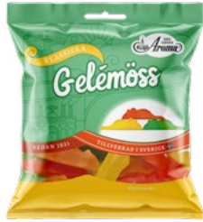
GELÉMÖSS Vikt: 80 g Art nr: 284