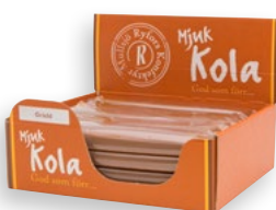
GRÄDDKOLA Antal: 20 st Art nr: 202101