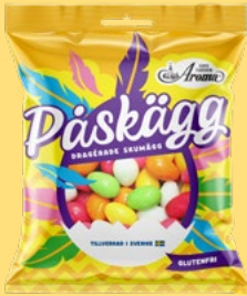
PÅSKÄGG Vikt: 130g Antal: 27 kfp/dfp Art nr: 7915