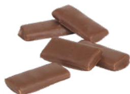
ÄKTA KROKANT Vikt: 3700 g Art nr: 6216