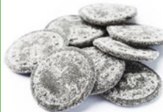
XL KLOCKOR, SALTA Vikt: 1800 g Art nr: 7148