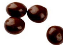
DALS GRÄDDKOLA Vikt: 5000 g Art nr: 64306