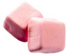
ROSA KUBIK Vikt: 1800 g Art nr: 66516