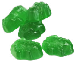
GRÖNA GRODOR Vikt: 2500 g 4500 g Art nr: 7113 7413