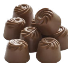
CHOKO TOFFÉ Vikt: 4000 g Art nr: 6293