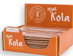
NÖTKOLA Antal: 20 st Art nr: 202103