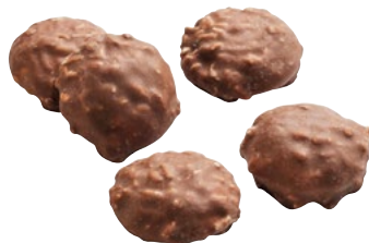
COCOSPRICKAR Vikt: 2100 g Art nr: 67986