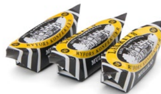
RYFORSKOLA SALTAKRITS Vikt: 3000g Art nr: 2303