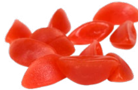
HALLONBÅTAR Vikt: 2200 g 4000 g Art nr: 7103 7303