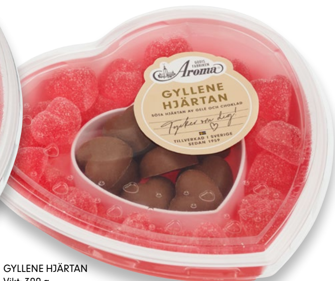
GYLLENE HJÄRTAN Vikt: 300 g Antal: 10 kfp/dfp Art nr: 36