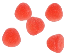
SMULTRON Vikt: 4000 g Art nr: 7306