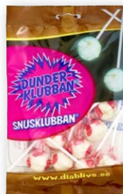
DUNDERKLUBBA 10-PACK Vikt frp: 70g Antal: 24 st/frp Art nr: D2541