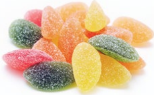
SURA BÅTAR Vikt: 1800 g Art nr: 7169