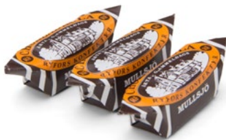
RYFORSKOLA CHOKLAD Vikt: 3000g Art nr: 2302

Mullsjö Ryfors Konfektyr är ett varumärke som är mest känt för sin klassiska gräddkola - Ryforskolan. Den finns med smak av både lakrits och choklad. Aroma har säljuppdraget både för Sverige och för export.