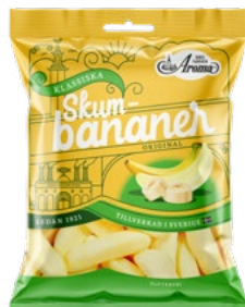
SKUMBANANER Vikt: 110 g 220 g Art nr: 7911 7924