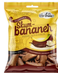
SKUMBANANER CHOKLAD Vikt: 100 g Art nr: 7912