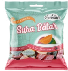
SURA BÅTAR Vikt: 80 g 115 g Art nr: 288 346