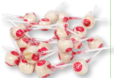
DUNDERKLUBBA Vikt frp: 9g Antal: 160st/frp Art nr: 5224

Maxi-klubban finns i tre klassiska smaker som går hem hos både stora och små. Den största favoriten, Dunderklubban, finns även i en mindre variant.