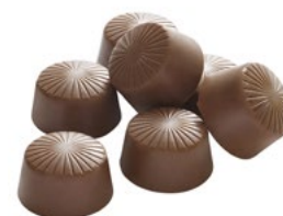
CHOKO MILKSHAKE Vikt: 4000 g Art nr: 6290