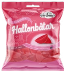
HALLONBÅTAR Vikt: 80 g 125 g 290 g Art nr: 283 343 653