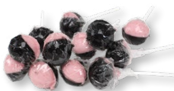
MAXI HALLON/SALTKLUBBA Vikt: 19g Antal: 100kfp/dfp Art nr: 5222