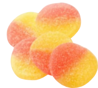
XL KLOCKOR, SYRLIGA Vikt: 1800 g 3500 g Art nr: 7134 7334