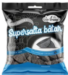
SUPERSALTA BÅTAR Vikt: 70 g 115 g Art nr: 289 349