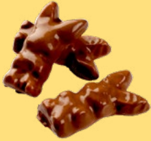
PÅSKHARAR CHOKO, LÖSVIKT Vikt: 1800g Art nr: 66176