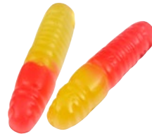
FRUKTMASKAR Vikt: 2500 g Art nr: 7174