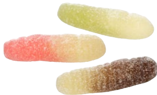
SURA MASKAR Vikt: 4000 g Art nr: 7399