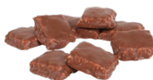
KOKOSRUTA Vikt: 2000 g Art nr: 06152