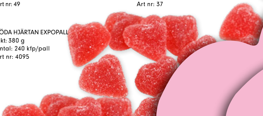
RÖDA HJÄRTAN EXPOPALL Vikt: 380 g Antal: 240 kfp/pall Art nr: 4095