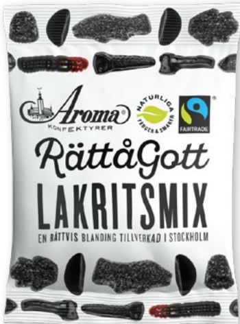
LAKRITSMIX Vikt 140 g 14 kfp/dfp Art nr: 408

konsument. RättåGott är inte bara smaskigt godis gjort med naturliga färger och smaker, det är även Fairtrade och gör på så sätt gott på fler ställen än i munnen.