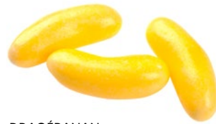
DRAGÉBANAN Vikt: 1500 g Art nr: 6513