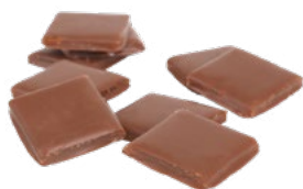
JORDNÖTSKROKANT Vikt: 1900 g Art nr: 04937