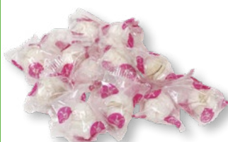
DUNDERKLUMP Vikt frp: 2000g Art nr: 5225