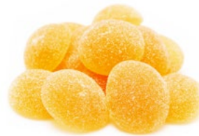
SYRLIGA PERSIKOR Vikt: 1800 g 4000 g Art nr: 7142 7342