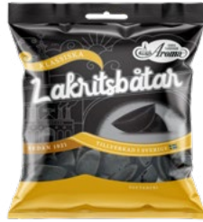
LAKRITSBÅTAR Vikt: 80 g 125 g 290 g Art nr: 282 342 652