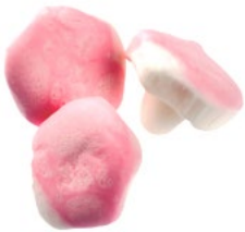
SKUMSVAMP Vikt: 1800 g Art nr: 66536