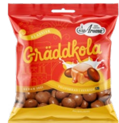
GRÄDDKOLA Vikt: 95 g 250 g Art nr: 7910 7917