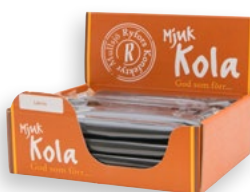
LAKRITSKOLA Antal: 20 st Art nr: 202109