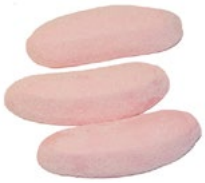
SUR JORDGUBBSBANAN I SKUM Vikt: 1800 g Art nr: 67996