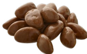
CHOKLADHALLONBÅT Vikt: 2000 g Art nr: 7140