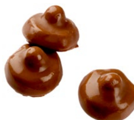
CHOKOSVAMP Vikt: 2200 g Art nr: 66176