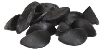
LAKRITSBÅTAR Vikt: 2200 g 4000 g Art nr: 7152 7352