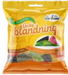
GODISBLANDNING Vikt: 80 g 125 g 290 g 500 g Art nr: 280 340 650 670