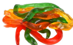
JÄTTEORMAR Vikt: 2500 g Art nr: 7107