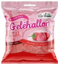
GELÉHALLON Vikt: 80 g 125 g 290 g Art nr: 281 341 655

Påsarna har även fått en uppfräschning och finns i fem olika storlekar, både för on-the-go och hemmakonsumtion. Utmärkta att lyfta fram i multiköpskampanjer där konsumenten själv kan mixa sina favoritsorter.