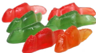
STORA RÄTTOR Vikt: 4500 g Art nr: 7310