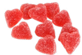
RÖDA HJÄRTAN SOCKRADE Vikt: 4000 g Art nr: 7312