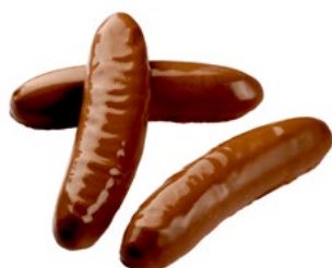
CHOKOBANAN Vikt: 2200 g Art nr: 66646