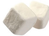
VIT KUBIK Vikt: 1800 g Art nr: 66686