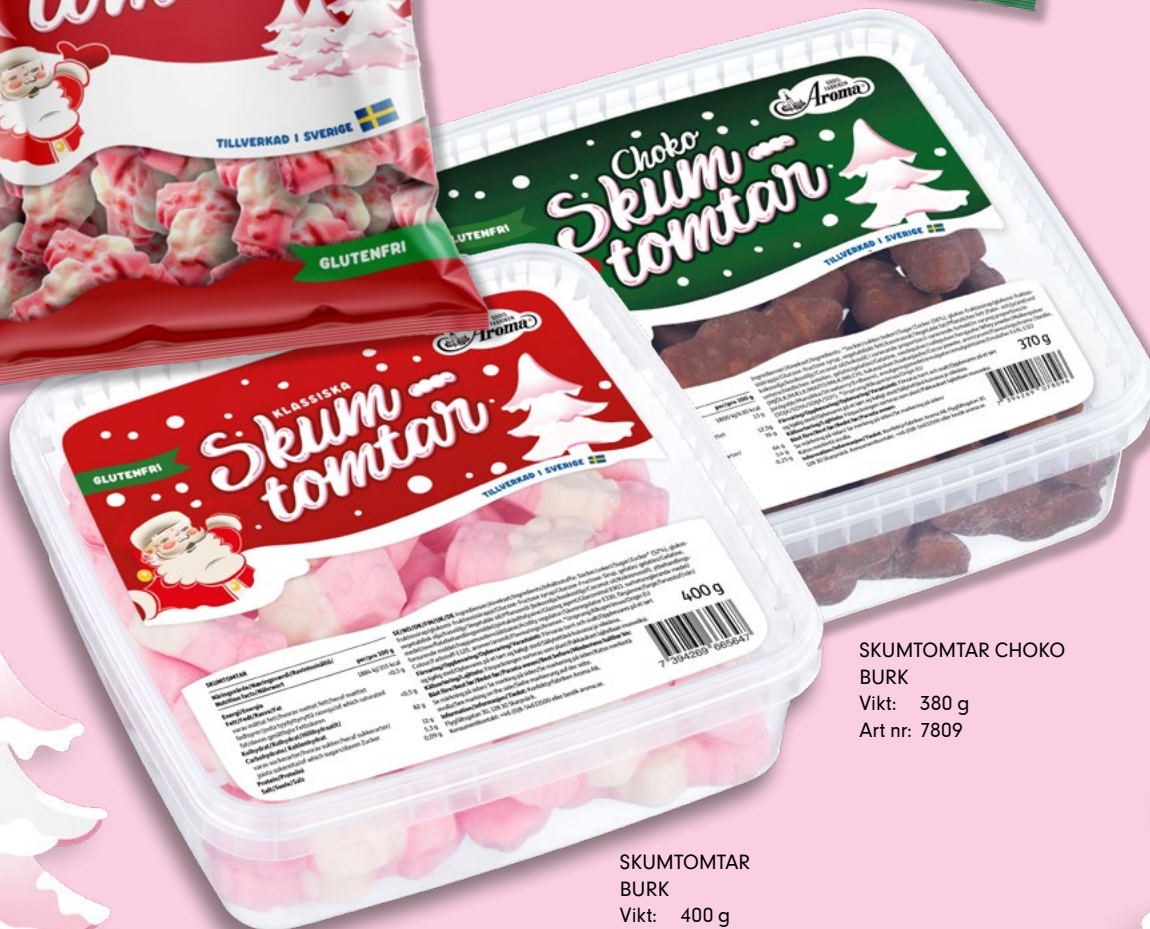
SKUMTOMTAR CHOKO BURK Vikt: 380 g Art nr: 7809