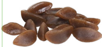
COLABÅTAR Vikt: 4000 g Art nr: 7353