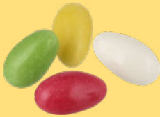
PÅSKHARAR CHOKO, LÖSVIKT Vikt: 3600g Art nr: 65576