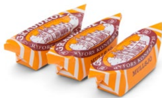
RYFORSKOLA GRÄDD Vikt: 3000g 130 g x 25 Art nr: 2301 Art. nr: 2809