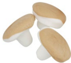
KOLASVAMP Vikt: 1800 g Art nr: 66746