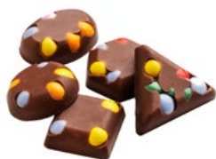
CHOKO RAINBOW Vikt: 4000 g Art nr: 6291