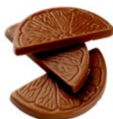
APELSINKLYFTA Vikt: 3400 g Art nr: 6294