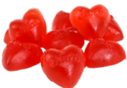
STORA HJÄRTAN Vikt: 4500 g Art nr: Art nr: 7302