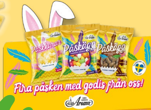
PÅSK EXPOPALL Vikt: Antal: 540 kfp/dfp Art nr: 2479