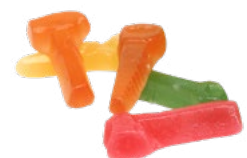
BLANDADE VERKTYG Vikt: 3500 g Art nr: 7387