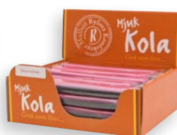
HALLON/LAKRITS Antal: 20 st Art nr: 202111