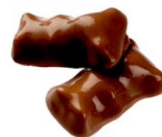
CHOKOBJÖRNAR Vikt: 2200 g Art nr: 66506