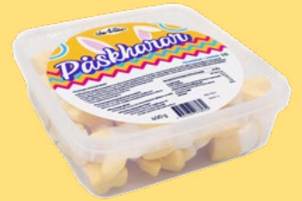
PÅSKHARAR Vikt: 400g Antal: 8 kfp/dfp Art nr: 7803