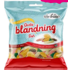
GODISBLANDNING SUR Vikt: 115 g Art nr: 348