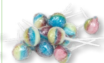
MAXI PIPPIKLUBBA Vikt: 19g Antal: 100kfp/dfp Art nr: 5223