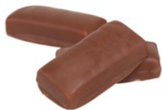
MOLLE BANANKOLA Vikt: 3700 g Art nr: 6222