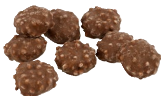
TOFFEE CRISP Vikt: 3300 g Art nr: 67196