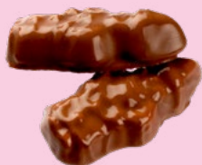
SKUMTOMTAR CHOKO Vikt: 2200 g Art nr: 66576

Våra svenska tomtar har dubblat i försäljning varje år sedan 2020.