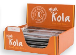
SALMIAKLAKRITS Antal: 20 st Art nr: 202108