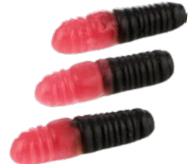
HALLONLAKRITS MASKAR Vikt: 3500 g Art nr: 7376