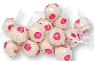
MAXI DUNDERKLUBBA Vikt frp: 19g Antal: 100kfp/dfp Art nr: 5221