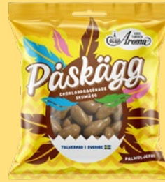
CHOKLADDRAGERADE SKUMÄGG Vikt: 90g Antal: 27 kfp/dfp Art nr: 7920