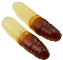
COLAMASKAR Vikt: 4500 g Art nr: 7373