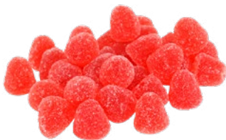
GELÉHALLON Vikt: 2200 g 4000 g Art nr: 7101 Art nr: 7301