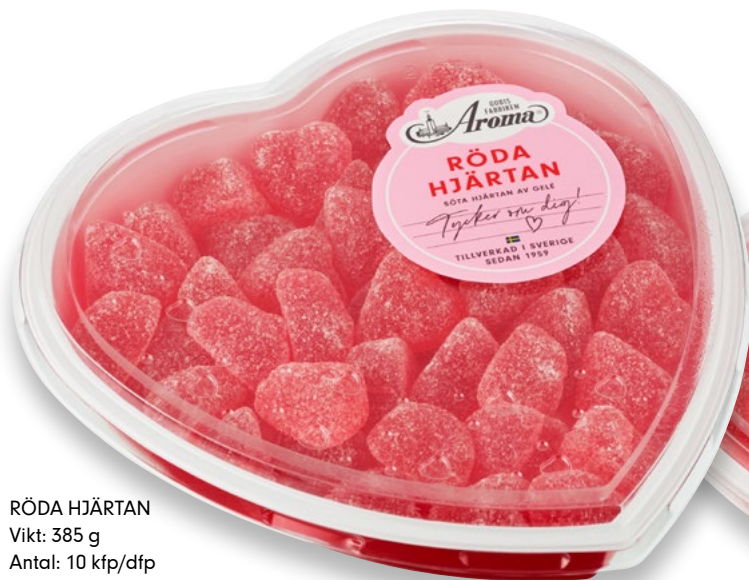
RÖDA HJÄRTAN Vikt: 385 g Antal: 10 kfp/dfp Art nr: 48

sin uppskattning och kärlek den 14 februari? Våra goda geléhjärtan passar perfekt året runt, exempelvis att lyfta fram på kampanj vid både Mors Dag och Fars dag.