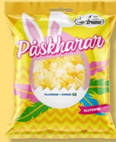
PÅSKHARAR, ANANAS & VANILJSKUM Vikt: 90g Antal: 27 kfp/dfp Art nr: 7922