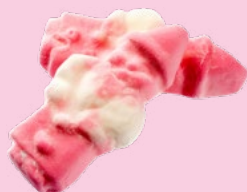
SKUMTOMTAR Vikt: 1700 g Art nr: 66566