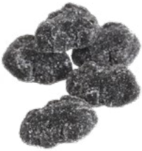
SALMIAKGRODOR Vikt: 4000g Art nr: 7323