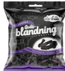
GODISBLANDNING LAKRITS Vikt: 115 g 260 g 410 g Art nr: 345 654 674