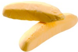
SKUMBANAN Vikt: 1800 g Art nr: 66526